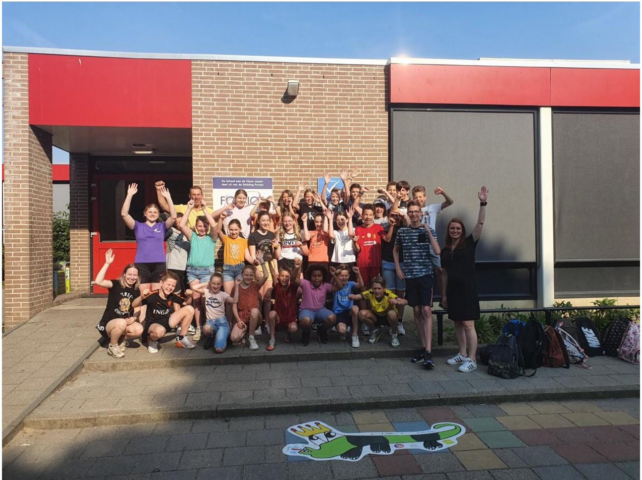
Groepsfoto kamp juni 2021